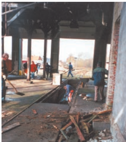
Oprydningsdag i Remisen