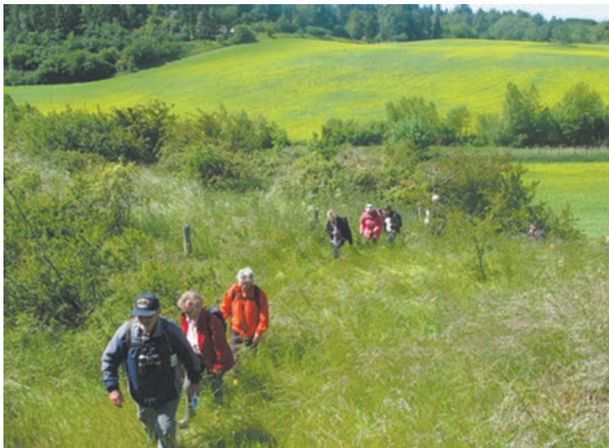
Foreningens medlemmer i det kuperede terræn ved Blanksøgård

fantastisk udsigt over landskabet. På trods af, at kun 14 personer deltog i traveturen, var den en succes, og den vil blive fulgt op af en ny travetur næste år i juni måned.