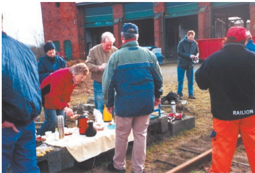
Lidt varmt gør godt under oprydningen ved Remisen

Bygnings- og Landskabskultur i Holbæk Kommune (FBL) d. 05.08.2009 besøgt Remisen. Man konkluderer på baggrund af besøget, at Remisebygningen har stor kulturhistorisk- og stor fortælle værdi på stedet. Man konstaterer, at bygningen trænger voldsomt til istandsættelse, men at det ikke vil være umuligt at redde den. Det vil kræve mange penge, og FBL ønsker derfor Remiseforeningen held og lykke i bestræbelserne på at skaffe midler til at gennemføre projektet. Kun tiden kan vise, om det vil lykkes at rejse de mange penge til Remisen i Tølløse!