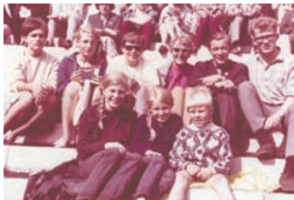
Landsstævnet i Århus 1966. Det er forfatteren med solbriller og hvid bluse midt i billedet.