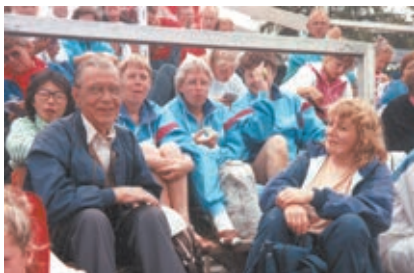
Venner og familie kigger på ved Landsstævnet i Horsens 1990.

Hjælpsomhed, fællesskab og varme. Om morgenen blev vi kontaktet af en lejransvarlig, som fortalte, at vi havde placeret vort telt for tæt på naboens! Nabolaget